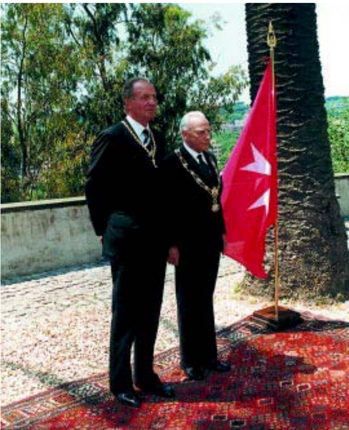
Sua Maestà il Re di Spagna Juan Carlos I o e S.A.E. il Gran Maestro dell'Ordine Frà Andrew Bertie.

l'incontro dei Cancellieri e dei Segretari Generali dei Priorati e delle Associazioni nazionali dell'Ordine ha dato risultati molto utili.